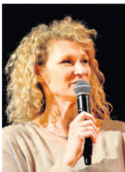
Olympiasiegerin Heike Henkel.

Alle Ergebnisse und Platzierungen der Schaumburger Sportlerwahl finden Sie auf Seite 26. Von der Nacht des Sports gibt es eine Bildergalerie und ein Video unter www.sn-online.de . In der gedruckten Montagsausgabe finden Sie an dieser Stelle noch weitere Fotos.